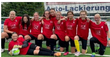
Unsere Fußballmannschaften haben bei den Meisterschaftsspielen richtig abgeräumt!