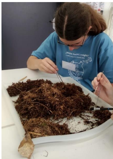
Vier Lernende aus der Klasse 9 nahmen am MINT-CAMP „Mathe macht's möglich“ teil.