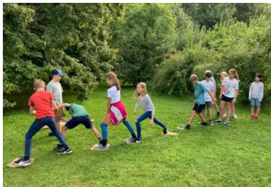
Teambuilding: Im Rahmen der Willkommenswochen besuchten unsere neuen 5er das Biologische Zentrum