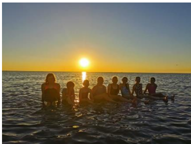
Cuxhaven 2023: Bestes Wetter, beste Stimmung – besser kann eine Klassenfahrt nicht sein!