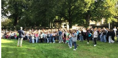
Singen für den Klimaschutz: Unsere Lernenden beteiligten sich am Klimasong vor der Burg Vischering