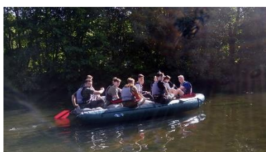
Abschlussfahrt der Q2 nach Tschechien: Kurs auf Richtung Abitur mit viel Freude!