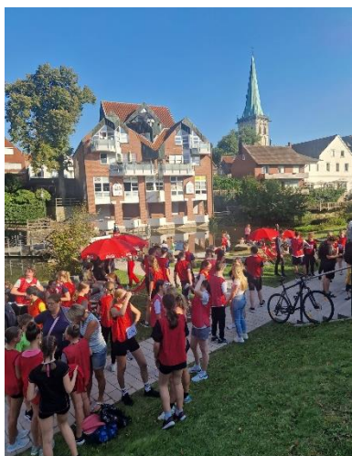
Stadtfestlauf 2023: Anton-Rot dominierte erneut den Stadtfestlauf – ein Fest für unsere Gemeinschaft!