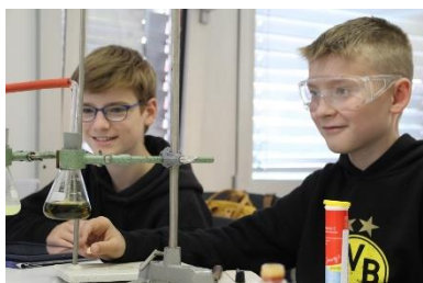
MINT-Tag der Klassen 8: Faszinierende Experimente begeisterten unsere 8er. Am Ende des Tages präsentierten sie ihre Ergebnisse souverän in der Aula.