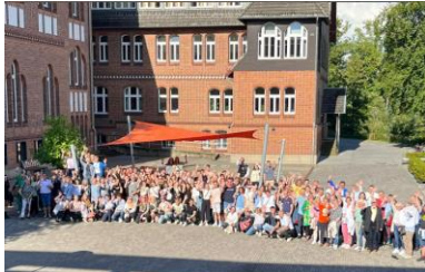
Sommerfest der Alumni: Zwischen 14 und 22 Uhr besuchten über 300 Ehemalige ihre alte Schule.