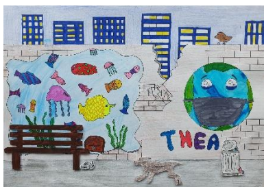
Street-Art am Anton: Inspiriert vom Künstler Banksy haben Lernende der Klassen 6 ihre eigene Street-Art gestaltet.