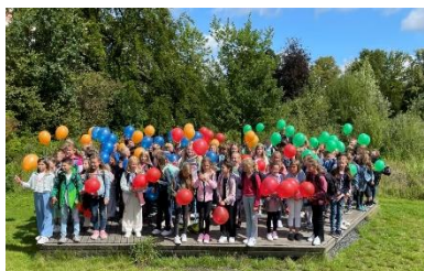
96 Ballons für 96 neue 5er am Anton: Wir wünschen euch einen tollen Start in unserer Gemeinschaft!