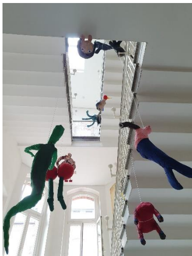
Neue Gäste: Unser Klostertreppenhaus beherbergt aktuell faszinierende Monster nach den Bildern von Bosch und Breughel.