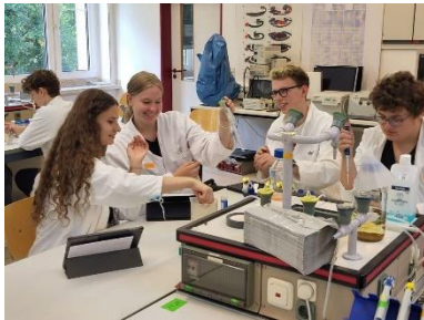
Fliegen- und Tomaten-DNA erkunden: der Biologie-LK der Q2 im Genetik-Praktikum