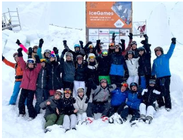
Endlich wieder im Schnee: Nach coronabedingter Pause konnte der diesjährige Wintersport-Projektkurs der Q1 wieder live vor Ort sein.