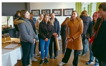
Die Ausstellung „Kohlestriche über das Klima“ ist noch bis Mitte Juni im Steverbett-Hotel anzuschauen!