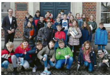
Unsere Klasse 5d besuchte im Rahmen des WP-Unterrichts Bürgermeister Mertens. Die vielen Fragen der Lernenden beantwortete der Bürgermeister sehr gerne.