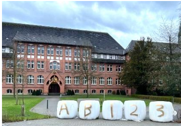
Mit dem Ende der Mottowoche beginnt für unsere Q2 die Abiturphase: Wir drücken euch die Daumen!