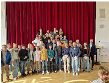
Nach dem Sportfest der Klassen 5-7 konnten zahlreiche Sieger_innen stolz ihre Urkunden in Empfang nehmen.