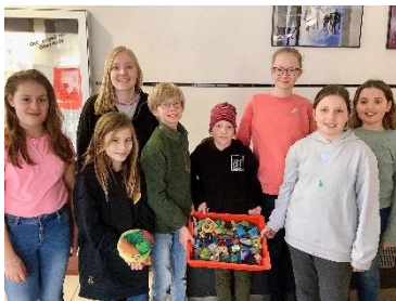
Glück to go gab es am Welttag des Glücks im Anton: Die Upcycling-AG hatte für alle Interessierten Glückssteine im Foyer ausgelegt.