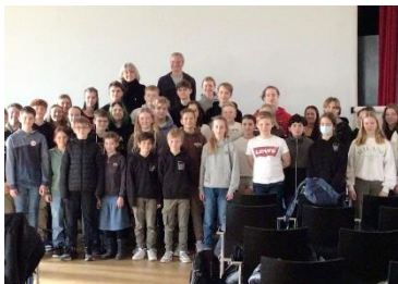
SV-Vollversammlung: Unsere SV plante unter anderem den Sponsorenlauf für die Senegalhilfe, der am vorletzten Schultag vor den Sommerferien stattfinden wird.