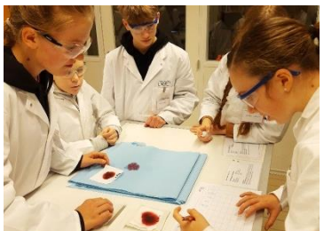
Die Klassen 8c und 8b besuchten das Chemie-Schülerlabor der Uni Münster. Unter anderem wurde ein Mordfall mithilfe chemischer Methoden gelöst.

Sehr geehrte Eltern, liebe Schüler_innen, liebe Kolleg_innen,