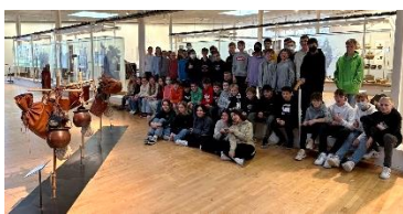
Typisch Latein: Bei zahlreichen Exkursionen, hier die Klassen 7, wird erlebt, dass und wie die Römer_innen unsere Heimat geprägt haben.