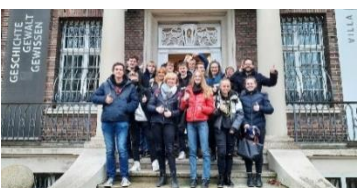
Informiert: Geschichtskurse der Q2 besuchen die Villa ten Hompel in Münster.