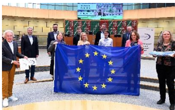
Werteorientiert: Das Anton wird als Europaschule ausgezeichnet.