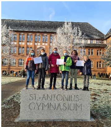
Prämiert: Aus den Klassen 5c, 5e und 5a kommen die meisten neuen Mitglieder im Förderverein – dafür gibt es eine Spende für die Klassenkasse.