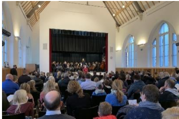
Interessiert: Mit Maske und 3G besuchen am Tag der offenen Tür Viertklässler und Lernende der Klassen 10 ihre neue Schule.