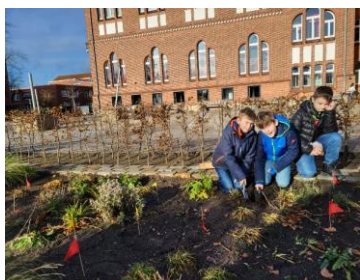
Wir lüften das Geheimnis: Überall am Anton tauchten in den letzten Wochen bunte Fähnchen in den Beeten auf. Warum? Weil die Bio-Klassen und -Kurse hier zahlreiche Krokus-, Tulpen- und Narzissenzwiebeln gesetzt haben, auf deren Blüten wir uns schon jetzt freuen.