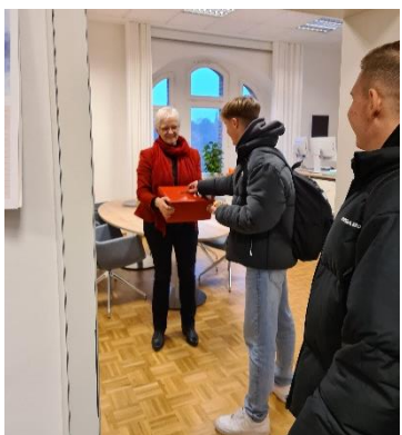
Im Rahmen unserer Change-Weeks spendeten zahlreiche Lernende und Eltern dafür, dass auf dem Schulhof bald neue Bäume gepflanzt werden. Diese Aktion, die auch der Schulträger großzügig begleitet hat, bildete den Abschluss der Change-Weeks.