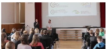
Engagiert, reflektiert und pfiffig beteiligten sich unsere Lernenden an der „Energievision 2050“.

schaulich und Latein praktisch, das könnte das Fazit all dieser Kurzreisen sein und die unteren Jahrgänge motivieren, fleißig Latein zu lernen.