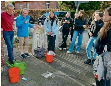
Unsere Lernenden beteiligen sich daran, die „Stolpersteine“ in Lüdinghausen wieder sichtbar zu machen, damit sie präsent im Stadtleben an das Leid deportierter jüdischer Mitbürger_innen erinnern.