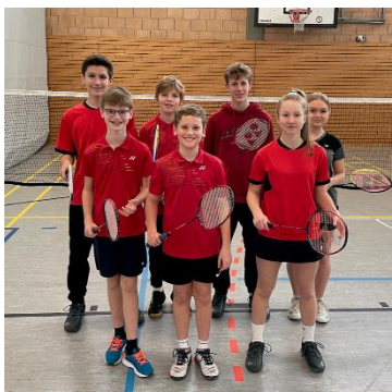
Große Erfolge: Unsere Badmintonspieler_innen setzen in ihrer Disziplin Ausrufezeichen.