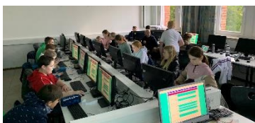
Livechat: Im Erdkundeunterricht chatten unsere Lernenden mit Naturwissenschaftler_innen zum Thema „Klimaschutz“ und erfahren, wie die Wissenschaftler_innen die aktuelle Situation und verschiedene Lösungsansätze bewerten.