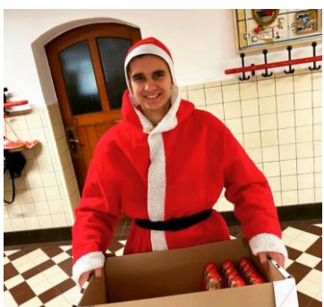
Die SV begeisterte bei ihrer traditionellen Nikolaus-Aktion: Liebevollen Botschaften konnten als Karte an einem Nikolaus an andere Lernende versendet werden.