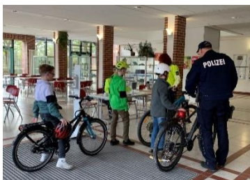
In der dunklen Jahreszeit ist ein sicheres und gut beleuchtetes Fahrrad besonders wichtig: Bei der jährlichen Aktion „Sicheres Fahrrad“ überprüfen Beamte_innen der Polizei die Räder unserer Lernenden.

sich auch andere Schulen für unseren Weg und kommen zum Hospitieren. Vertreter_innen aus Wirtschaft und Hochschulen beschrieben auf der Tagung BYOD als authentischen Weg beim Lernen für die digitale Zukunft.