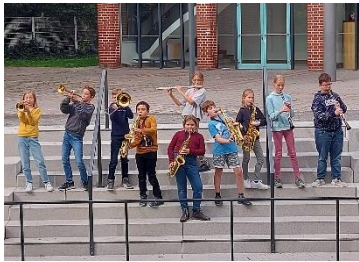
Laut und deutlich: Unsere Bläser-AG lädt zum Adventskonzert ein.