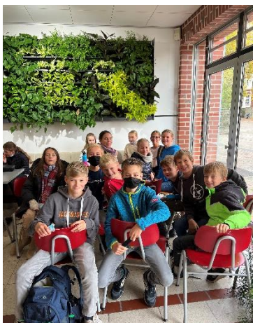
Unsere grüne Wand im Foyer ist endlich da! Eine ganz neue Lernatmosphäre ist entstanden und begeistert.