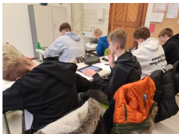
Googeln während der Klassenarbeit? Die Digitalität und unser BYOD-Konzept eröffnen uns neue lebensnahe Prüfungsformate, die wir sukzessive testen.