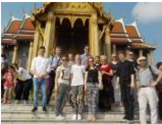
Bangkok/Thailand Jg. Q1