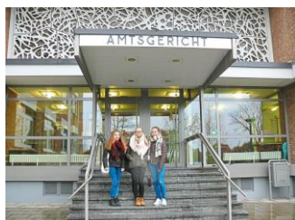
Betriebspraktikum Jg. EF

gerne berichte ich vor Ostern wieder aus unserem abwechslungsreichen Schulalltag.