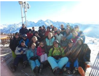
Ahrntal/Italien Sportprojektkurs Jg. Q1