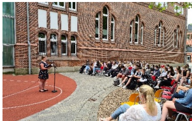
Poetry Slam: Die EF präsentiert ihre Gedanken zum Mund-Nasen-Schutz in Pandemiezeiten