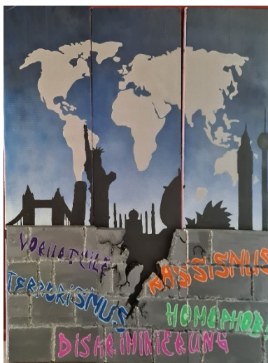
Mauerprojekt der EF