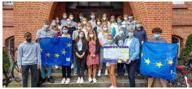
Fit in Europa: Die 9b gewinnt beim Europaquiz