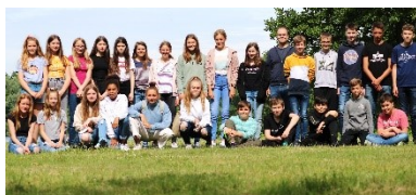
Verabschiedungen: Die Klasse 7b beim Web-Quest im Biologischen Zentrum