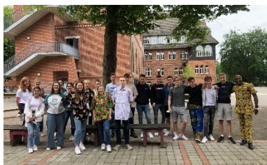
Expertengespräch: Der Englisch-LK der Q1 informiert sich über Nigeria