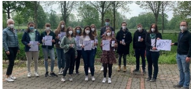
Premiere: Teilnehmende des 1. Facharbeits- slams der MINT-Fächer