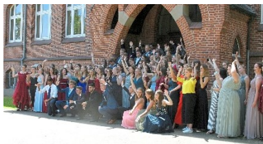
Auf in den neuen Lebensabschnitt: 83 Abitu- rient_innen am Anton