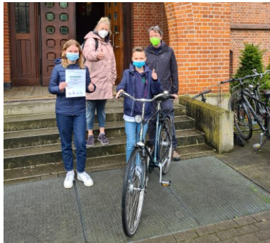
Sportlich und nachhaltig: Die Klasse 7a ist erfolgreich beim Stadtradeln