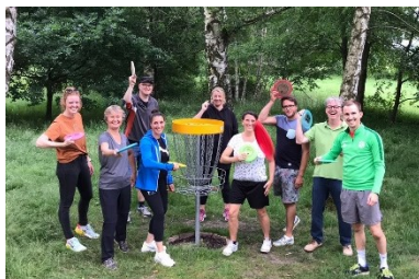
Komplexe Herausforderung: Die Fachschaft Sport bildet sich im Disc-Golf fort